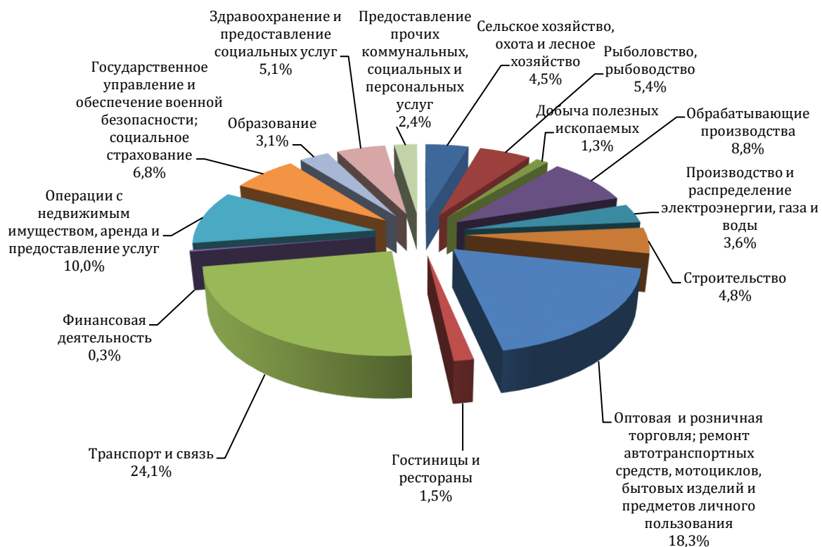
Рисунок 1.4.1. Структура валового регионального продукта Приморского края в 2016 г.